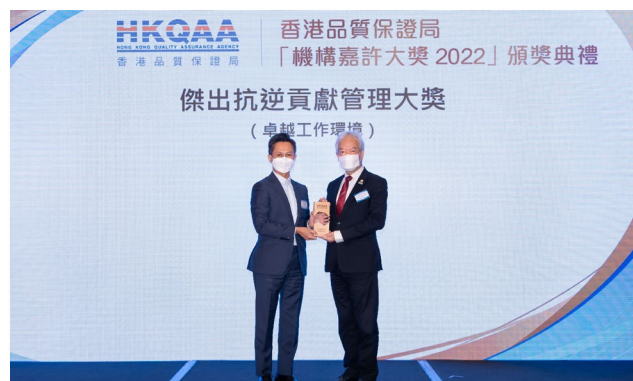
中國建設銀行(亞洲)股份有限公司

傑出 ESG 先導管理大獎 (供應鏈及物流) - 綠色貢獻機構 (應對氣候變化)