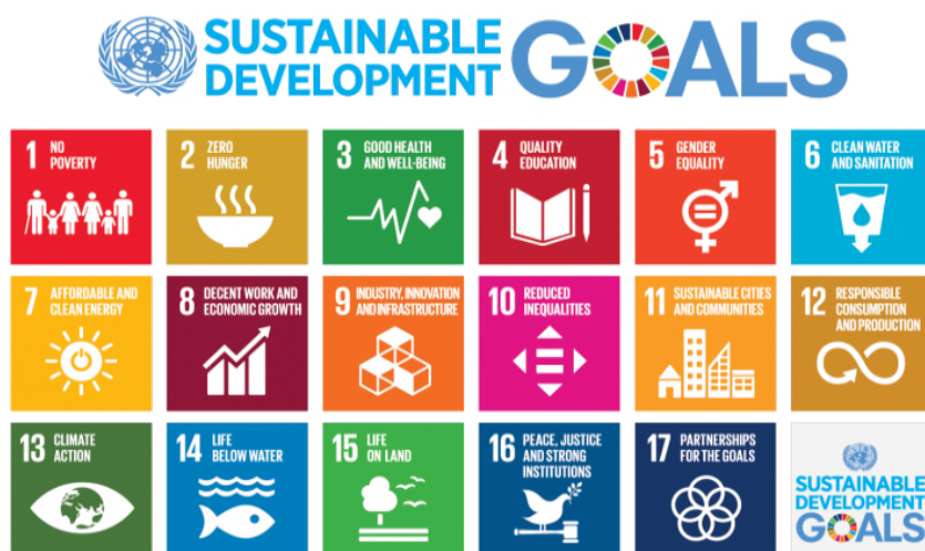
圖1—聯合國「2030可持續發展目標」

現今，不少人對「可持續發展」概念相當熟悉。這個概念的定義源於世界環境與發展委員會在1987年發布的《布倫特蘭報告——我們共同的未來》：「既能滿足當代人的需求，同時又無損未來世代自身需求的發展模式。」這個概念追求社會、環境和經濟發展的平衡協調，現已納入聯合國「2030可持續發展目標」，如圖1所示。