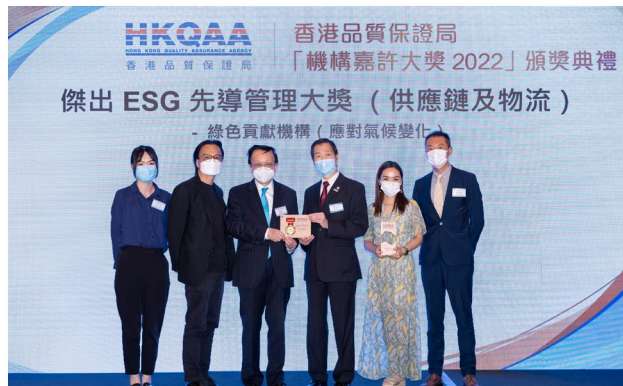
嘉宏航運有限公司

傑出 ESG 先導管理大獎 (供應鏈及物流) - 綠色貢獻機構 (應對氣候變化)