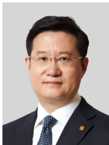
招商局港口控股有限公司 董事會主席鄧仁杰 傑出ESG貢獻領袖