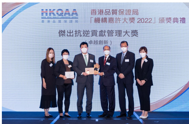
富城集團 傑出抗逆貢獻管理大獎 (卓越創新)