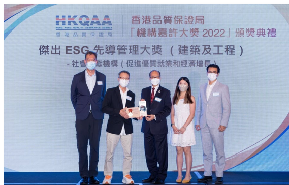
順源建築有限公司

傑出 ESG 先導管理大獎 (建築及工程) - 社會貢獻機構 (促進優質就業和經濟增長)