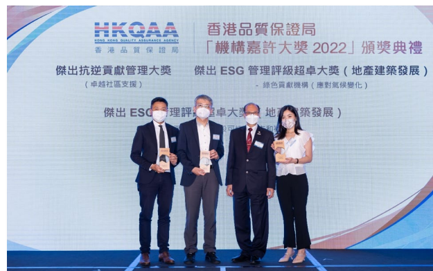
新鴻基地產發展有限公司