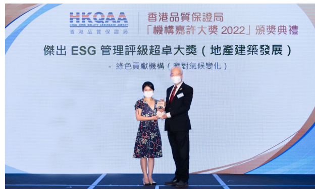
信和置業有限公司

傑出 ESG 先導管理大獎 (建築及工程) - 社會貢獻機構 (促進優質就業和經濟增長)