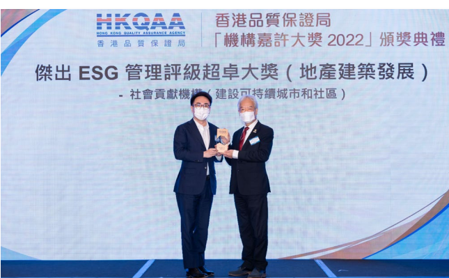
恒基兆業地產有限公司

傑出 ESG 管理評級超卓大獎 (地產建築發展) - 社會貢獻機構 (建設可持續城市和社區)