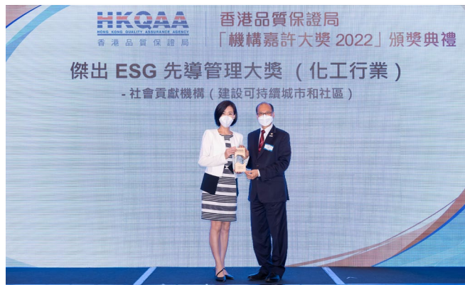
葉氏化工集團有限公司 傑出 ESG 先導管理大獎 (化工行業) - 社會貢獻機構 (建設可持續城市和社區)