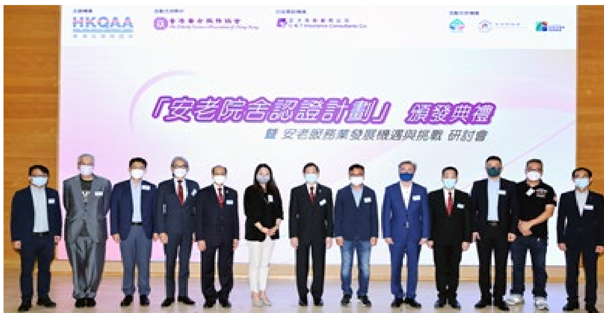
香港品質保證局成員與來自政府及業界的嘉賓、講者、活動支持夥伴、贊助機構以及支持機構代表合照。