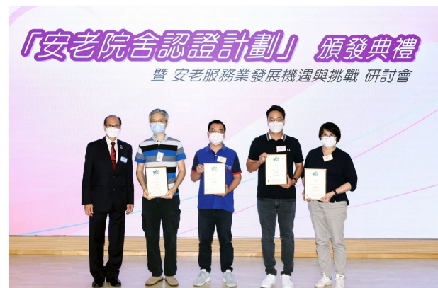
安老院舍認證計劃證書頒發典禮