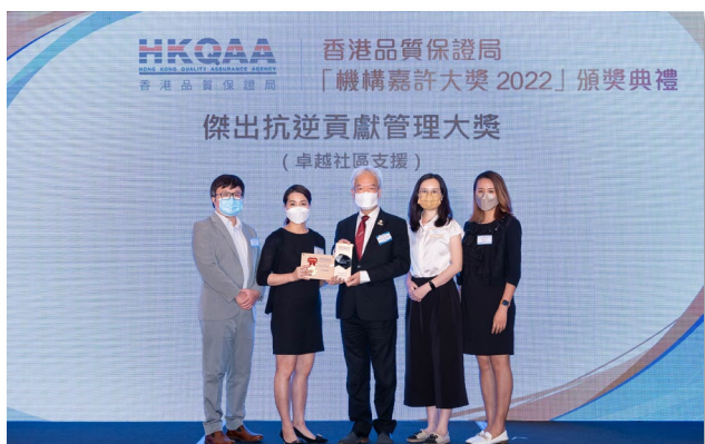
中國聯通國際有限公司