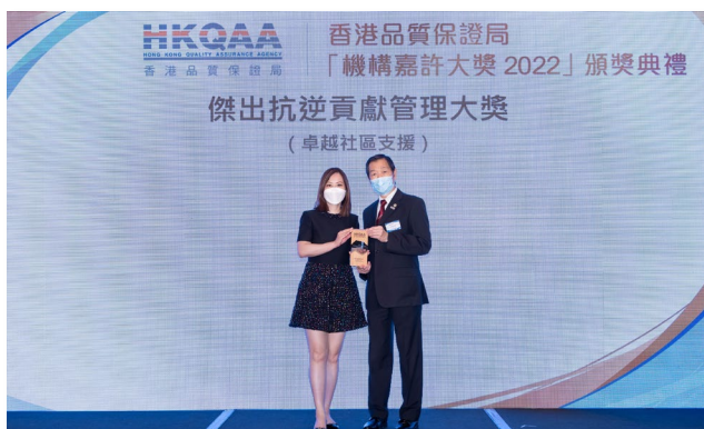
大家樂集團有限公司