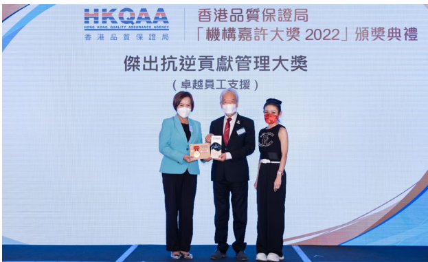
中國光大銀行股份有限公司香港分行