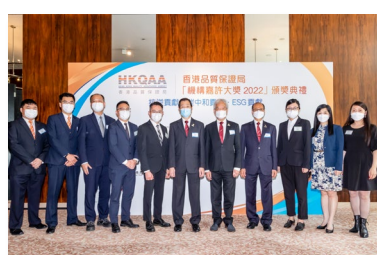
不同機構代表出席是次活動